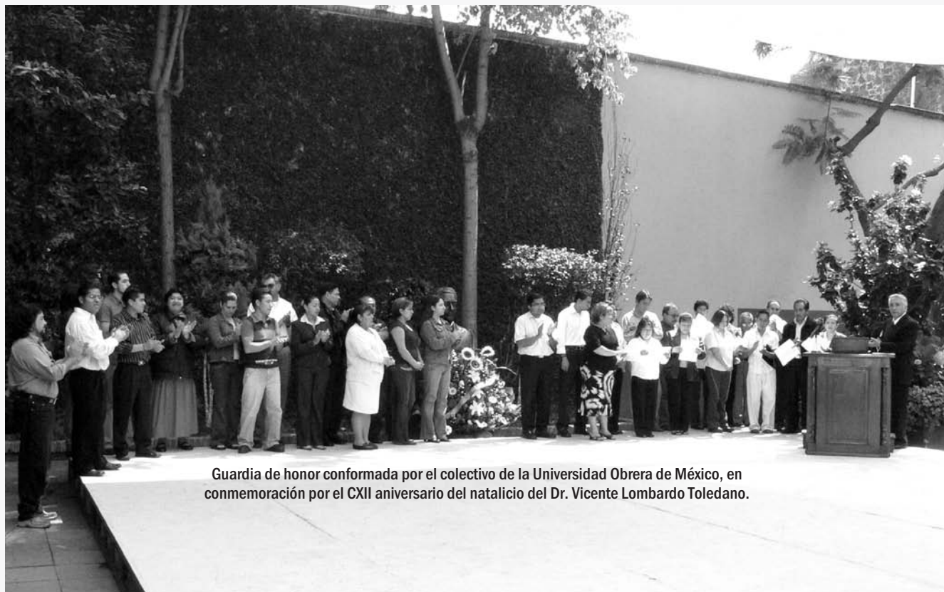
Guardia de honor conformada por el colectivo de la Universidad Obrera de México, en conmemoración por el CXII aniversario del natalicio del Dr. Vicente Lombardo Toledano.